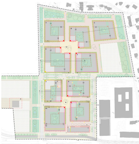
PLQ : plan d'aménagement

ADR : paysage, espaces publics Citec : mobilité CSD : gestion des matériaux, schéma directeur de gestion des eaux Amstein+Walthert : concept énergétique territorial Créateurs Immobiliers : répartition et localisation des droits à bâtir, montage opérationnel