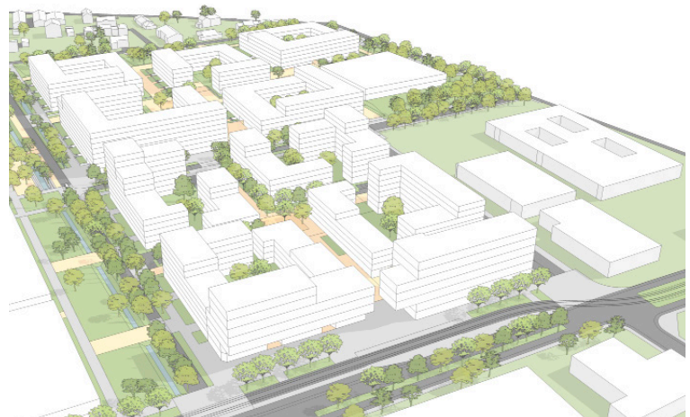
Maquette 3D illustrant les volumes et les espaces publics

Tout le processus d'établissement du PLQ a été accompagné par une démarche de concertation auprès des différents acteurs concernés : autorités politiques (CA, CM), propriétaires, voisins, associations, services techniques communaux et cantonaux.