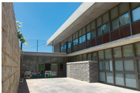
Haut : école Rachel Eddei – Sebael - Liban Droite : organigrame type des surfaces de construction scolaire