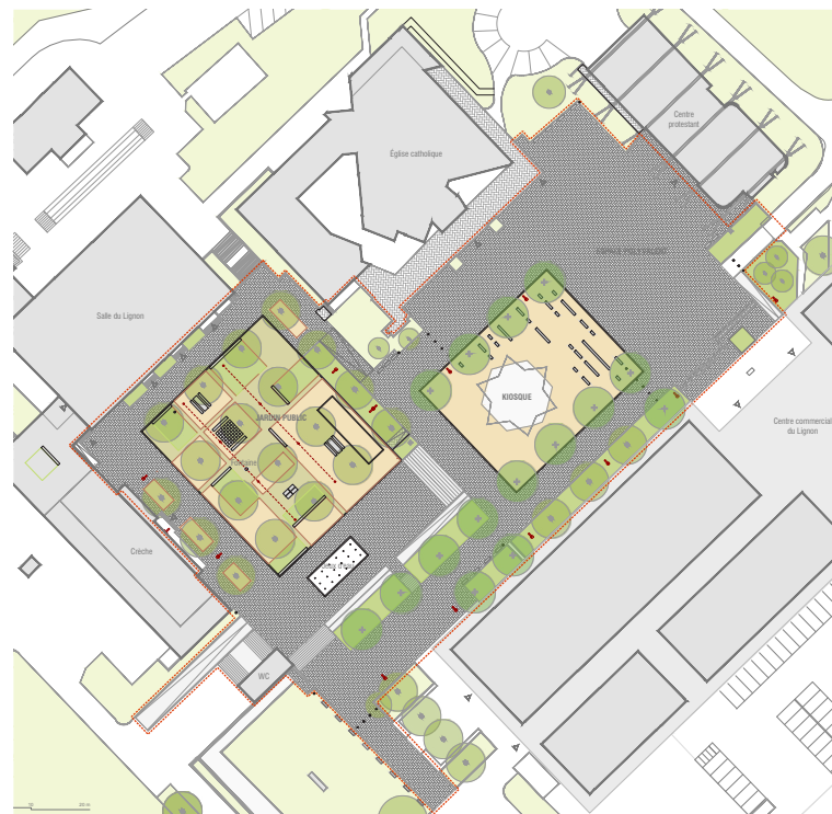
Plan du projet