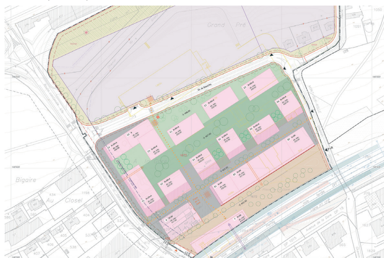
Extrait du plan de quartier

urbaplan a été mandaté pour établir le plan de quartier ainsi que le rapport d'impact sur l'environnement qui l'accompagne. Les réflexions menées sur le secteur se sont prolongées par l'établissement d'un schéma directeur pour la plateforme de la gare conduit par la Commune en partenariat avec la Région, le Canton et les CFF.