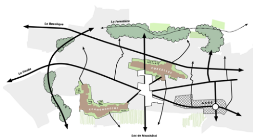
Schéma de la trame de mobilités douces (projet de territoire de Corcelles-Cormondrèche, 2018)

L'instrument choisi prend la forme d'une vision directrice qui présente la vision globale et partagée du développement du secteur. Elle constitue un document de référence servant de base de discussion avec les différents acteurs du développement du secteur (propriétaires fonciers, autorités communales et cantonales, CFF). Il est prévu qu'elle soit validée par les services cantonaux avant l'entrée en vigueur du PAL révisé (prévue en 2024-2025).