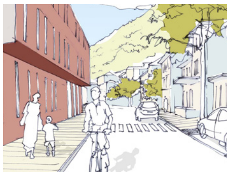
Perspective sur le plateau de la gare