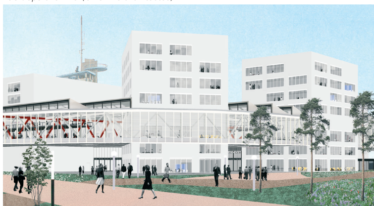
Vue depuis le N-O (OKGDVS architectes)

La remise du bâtiment et sa mise en exploitation est prévu courant 2024.