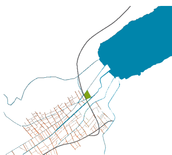
Localisation du site entre urbanisation et plaine agricole

Partenaires Verzone Woods Architectes Sàrl RR&A SA BG Ingénieur Conseils SA