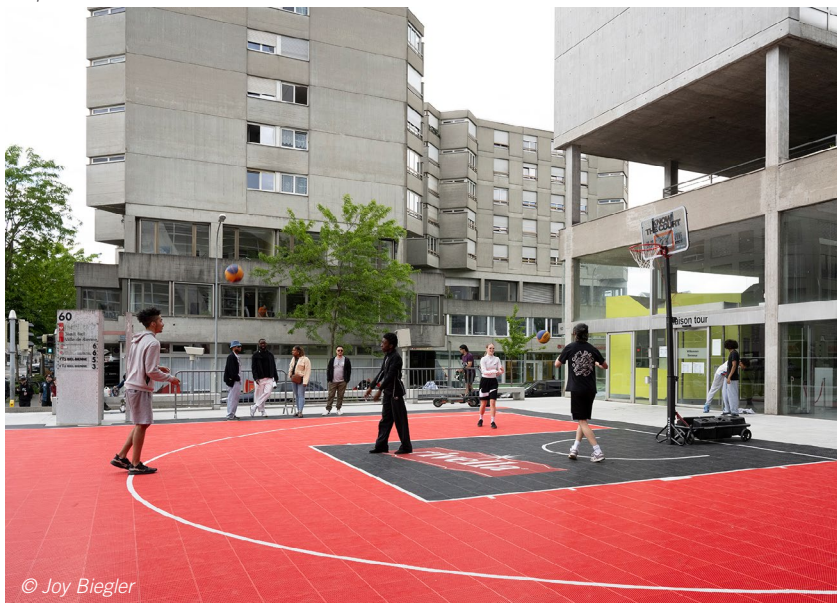
Basket et afterwork dans le cadre du programme Fullviel