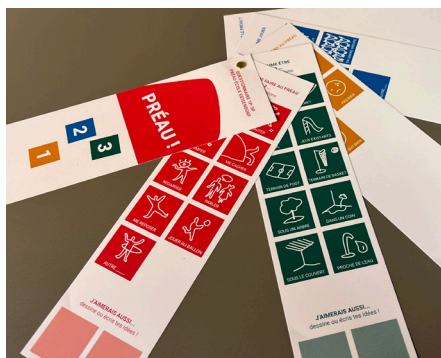
Matériel du processus 1,2,3 Préau !